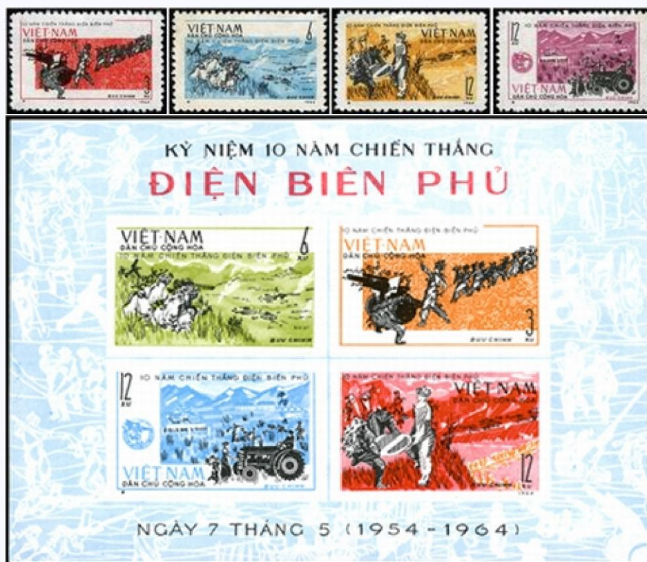
Bộ tem Kỷ niệm 10 năm chiến thắng Điện Biên Phủ”

Từ đó đến nay, vào các dịp kỷ niệm năm chẵn (theo chu kỳ 10 năm), Việt Nam đều phát hành tem về đề tài chiến thắng Điện Biên Phủ. Cụ thể: