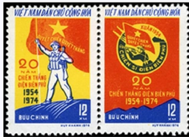
Bộ tem Kỷ niệm 20 năm chiến thắng Điện Biên Phủ”.

Bộ tem Kỷ niệm 20 năm chiến thắng Điện Biên Phủ ”, gồm 2 mẫu tem do họa sĩ Trần Huy Khánh thiết kế, phát hành ngày 7/5/1974; Một mẫu thể hiện hình ảnh chiến sỹ Điện Biên với lá cờ Quyết chiến - Quyết thắng” đứng trên nóc hầm Đờ Ca-xtơ-ri, một mẫu thể hiện huy hiệu Chiến sỹ Điện Biên”, phần thưởng cao quý dành cho những người lính đã tham gia chiến dịch Điện Biên lịch sử.