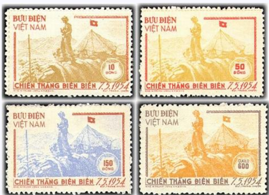
Bộ tem đầu tiên về Chiến thắng Điện Biên Phủ.

Theo danh mục tem Bưu chính Việt Nam, vào tháng 10/1954, chỉ 5 tháng sau chiến thắng lịch sử Điện Biên Phủ (ngày 7/5/1954), ngành Bưu chính đã kịp ghi dấu sự kiện quan trọng này bằng việc phát hành bộ tem Chiến thắng Điện Biên Phủ ” gồm 4 mẫu tem, do họa sĩ Bùi Trang Chước thiết kế. Bộ tem tái hiện thời khắc chiến sỹ Điện Biên bên cạnh lá cờ chiến thắng tung bay trên nóc hầm Đờ Ca-xơ-ri.